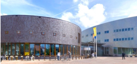
Heemskerk | BivT hoofdlocatie