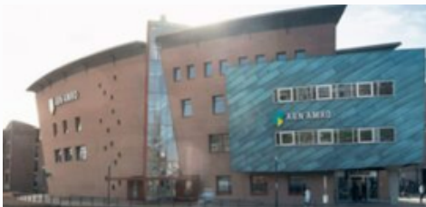
Amersfoort | BivT locatie