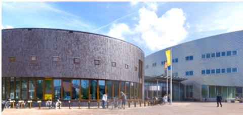
Heemskerk | BivT hoofdlocatie