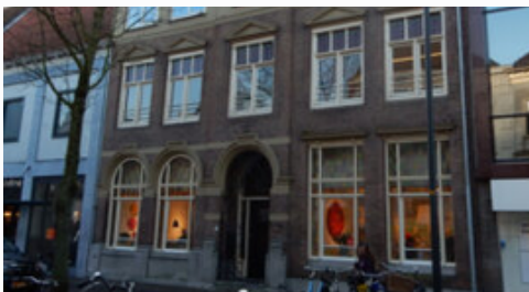
Zaltbommel | BivT locatie