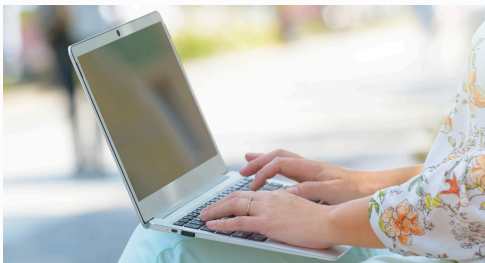
Online zoom en thuisstudie